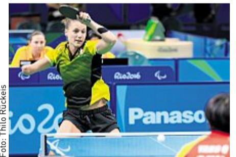
Natalia Partyka holt sich im Finale der Klasse 10 in Rio 2016 die Goldmedaille.