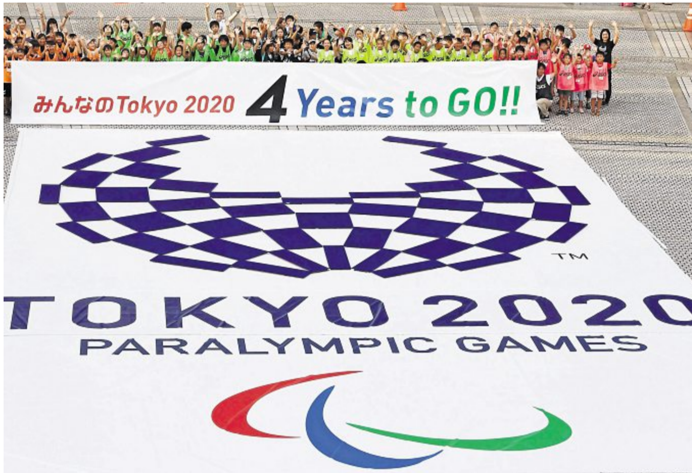
Tchau Rio, Konnichiwa Tokio: Die Japaner zählen schon die Jahre, Monate und Tage herunter bis zum Start der nächsten Sommerspiele.