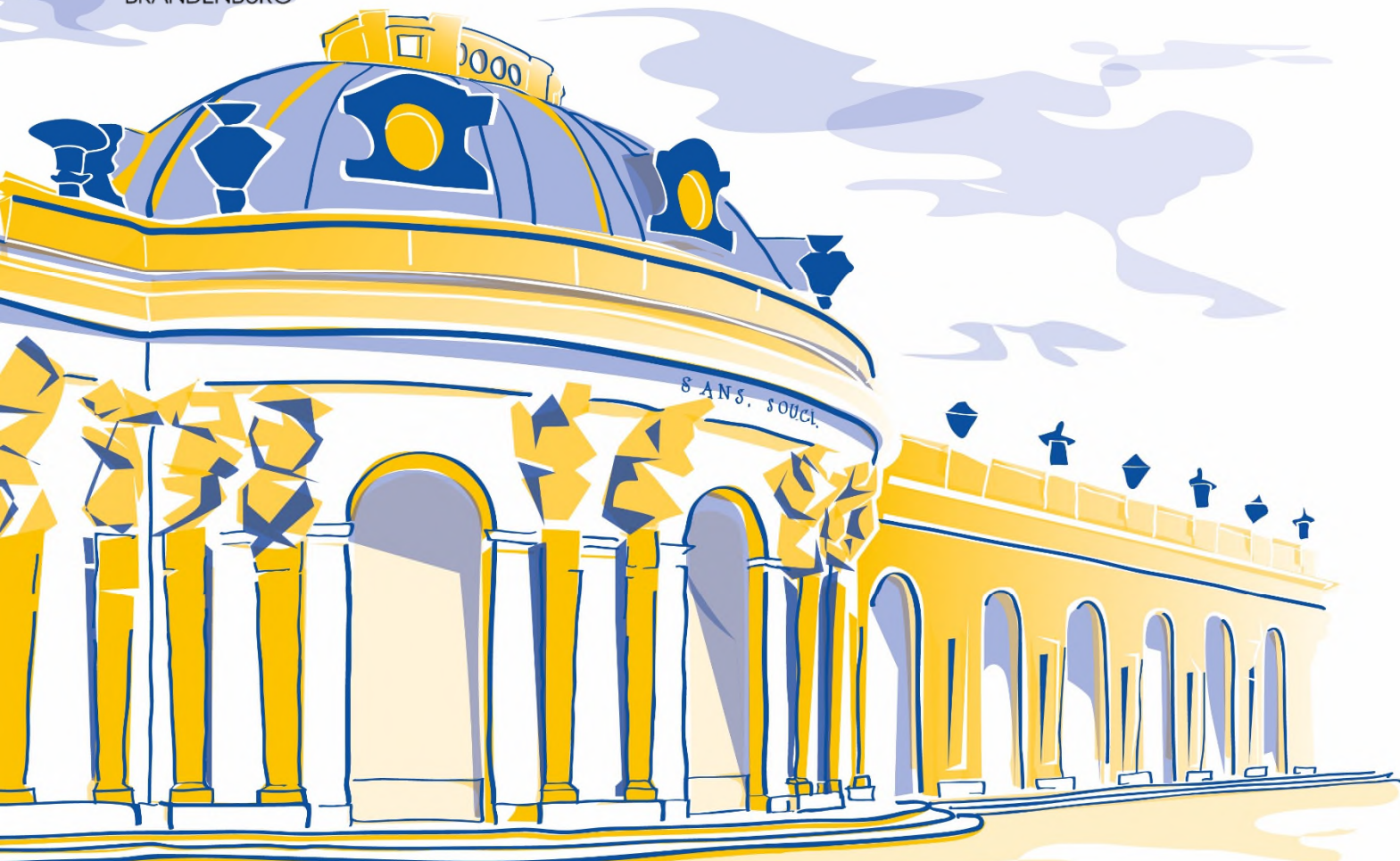
Schloss Sanssouci in Potsdam