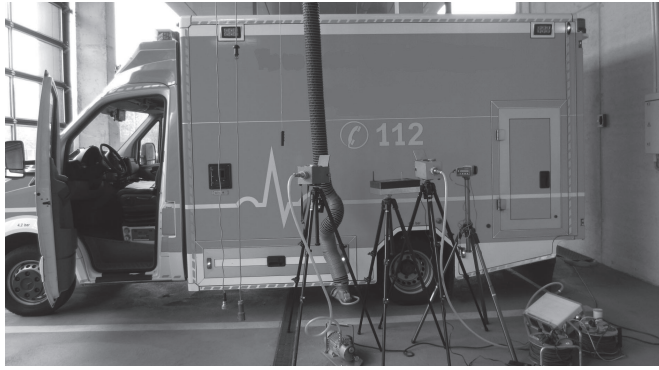
Bild 5. Überprüfung der Wirksamkeit einer mitlaufenden Absaugvorrichtung im Abstellbereich eines Rettungsdienstes.

derlich, wenn sichergestellt wird, dass sich beim Ausfahren und danach niemand im Abstellbereich aufhält und für ausreichende Nachlüftung gesorgt ist. Auch andere Schutzmaßnahmen können zur Anwendung kommen. Im Gegensatz zur mitlaufenden Absaugvorrichtung muss dann jedoch für die Gefährdungsbeurteilung mit im Regelfall einer Messung belegt werden, dass diese Schutzmaßnahme wirksam ist. Für die Querlüftung durch gegenüberliegend geöffnete Hallentore ist das Vorgehen zur Wirksamkeitsüberprüfung beispielhaft in [15] beschrieben.