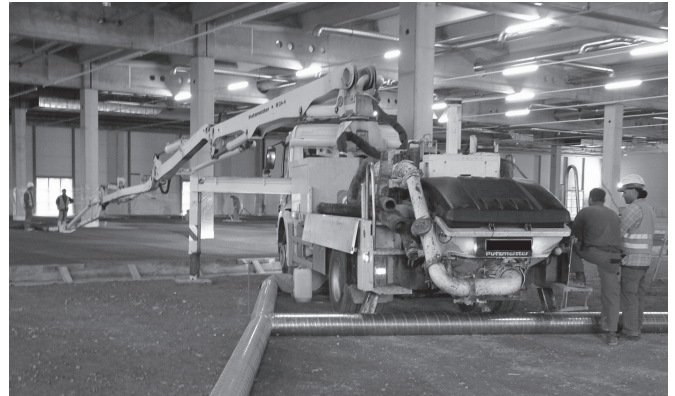
Bild 4. Betonpumpe in einer Halle mit Absaugung am Auspuff.

Ein Grund hierfür war sicherlich, dass im Anhang der letzten Fassung der TRGS 554 lediglich konkrete Schutzmaß-