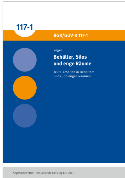
Bild 3 Titelbild der DGUV-Regel Behälter, Silos und enge Räume.