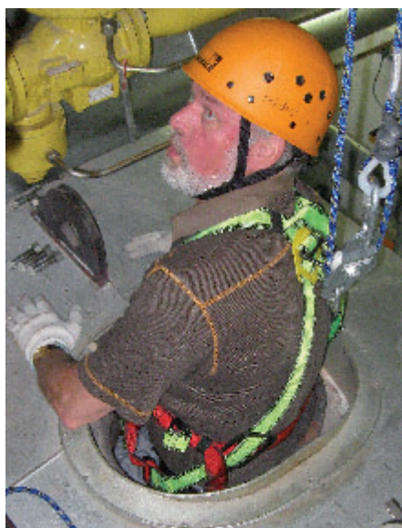
Bild 4 Einstieg in Mannloch.

Beim DIN-Normenausschuss Chemischer Apparatebau wurde der Antrag zur DIN EN 13445-5 intensiv diskutiert.