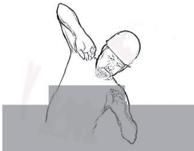
Bild 1 Einfädeln in einen Druckbehälter.

Um z. B. zu Wartungs-, Reparatur- und Überprüfungs Zwecken in einen Druckbehälter einzusteigen, muss sich eine Person durch ein normgerechtes ovales Mannloch mit Abmessungen von 320 mm x 420 mm regelrecht einfädeln (Bild 1). Diese Öffnung entspricht ungefähr den Maßen eines DIN A 3 Blatts. Sollte es zu einem medizinischen Notfall kommen, so gestaltet sich die Rettung einer Person durch solch einen kleinen Einstieg äußerst schwierig, die z. B. durch eingeschränkte Beweglichkeit bis hin zur Bewusstlosigkeit nicht mithelfen kann, sich durch die Öffnung wieder auszufädeln. Das wiederum