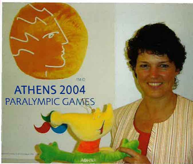
Ute Vogt, Parlamentarische Staatssekretärin beim Bundesminister des Innern, über die Faszination der Paralympischen Spiele und das Engagement des Bundes für den deutschen Behindertensport

•Gibt es für Sie Unterschiede zwischen den Olympischen und den Paralympischen Spielen?